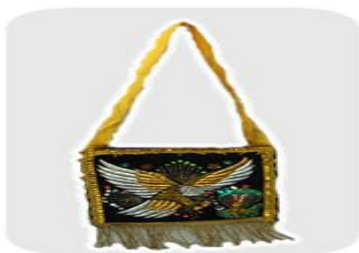
Walqui o chuspa