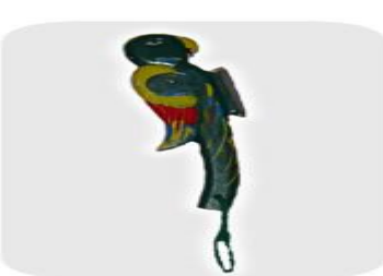
Machete o hacha